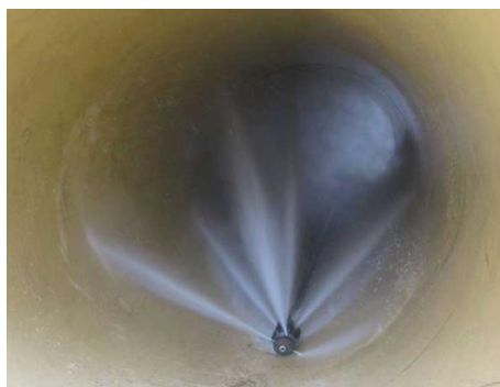
Kanalreinigungsdüse im Einsatz

Zur Beseitigung der Ablagerungen gleitet eine Reinigungsdüse langsam vom Fahrzeug aus durch den zu reinigenden Kanal. Dabei gibt es einen Vorschub durch den Hochdruckwasserstrahl. Beim anschließenden Zurückziehen der Düse wird das gelöste Material vor der Düse zum Fahrzeug hin transportiert. Dort wird es mit Hilfe eines Saugschlauches aufgenommen.