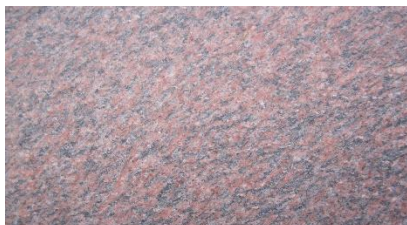
ROJO ALTAMIRA Granit