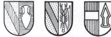
Wappen der Gemeinden DENZLINGEN-VÖRSTETTEN-REUTE

Die Verbandsgemeinden Denzlingen, Vörstetten und Reute liegen in unmittelbarer Nachbarschaft zur Stadt Freiburg i. Br. mit hervorragenden ÖPNV-Verbindungen und vielfältigen Freizeiteinrichtungen.