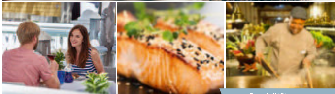
Spezialitäten vom Mongolengrill