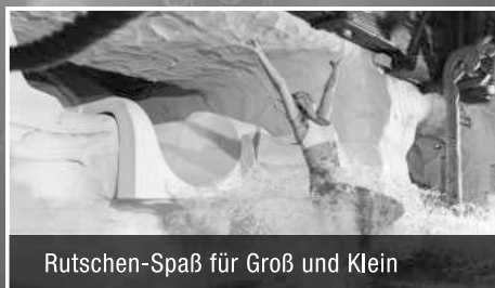
Rutschen-Spaß für Groß und Klein