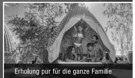
Erholung pur für die ganze Familie