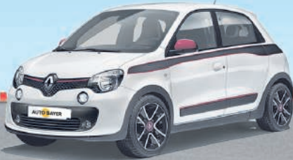
RENAULT TWINGO HIGHLIGHT SCE 70 ECO 2