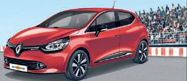
RENAULT CLIO HIGHLIGHT 1.2 16V 65

• 0,00 % eff. Jahreszins • inkl. 5 Jahren Garantie