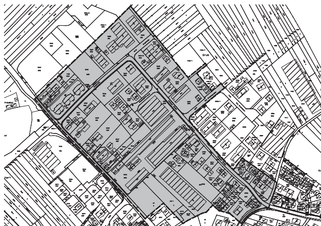
Gemeinde Vörstetten Bebauungsplan „Gewerbegebiet Grub 3. Änderung“ und Veränderungssperre

Ferner wird darauf hingewiesen, dass nach § 4 Abs. 4 GemO BW Satzungen, die unter Verletzung von Verfahrens- oder Formvorschriften der GemO oder auf Grund der